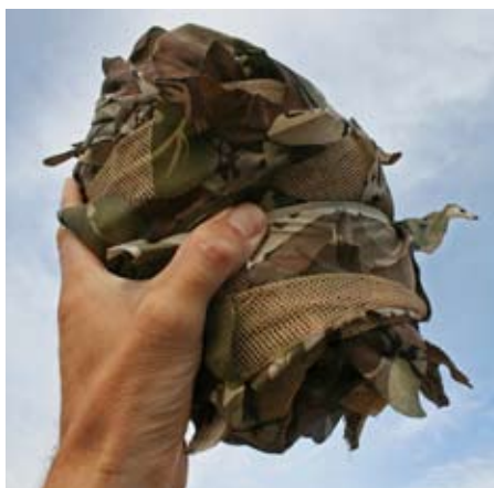
Kamuflasjesettet er svært kompakt og veier kun 590 gram.

Dressen er rask og grei å ta på og av – mye er gjort i løpet av ett minuttstid. Det er et