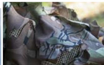
Plaggene er laget i et nettingstoff, så er kamostoff sydd på og fliket opp. Det gir en luftig og effektiv kamuflasje

stort pluss at det går greit å dra på buksa med jaktstøvler på. Kamostoffet er tynt og jeg har ikke reagert på at det lager noe særlig lyd under bruk.